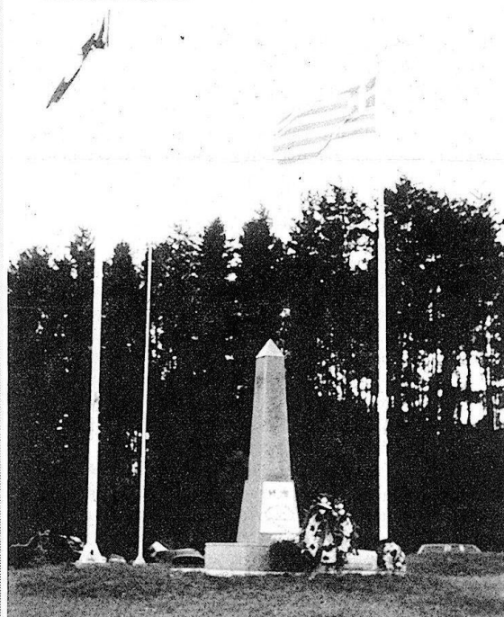
Το Μνημείο των Ηρώων στο πάρκο της Αδελφότητας Αραχοβιτών Toronto με τη γαλανόλευκη σημαία.

Στέλνουμε και το ετήσιο πρόγραμμα εκδηλώσεων της Αδελφότητάς μας. Με πατριωτικούς χαιρετισμούς Το Διοικητικό Συμβούλιο